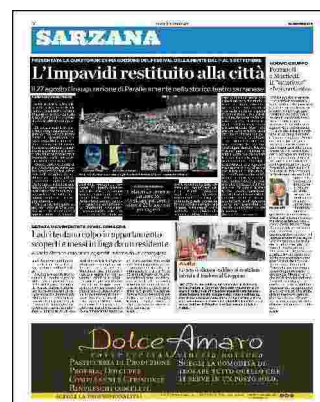
Folla alla Fortezza per uno degli eventi del Festival. Sopra alcuni dei relatori

Ritaglio stampa ad uso esclusivo del destinatario, non riproducibile.